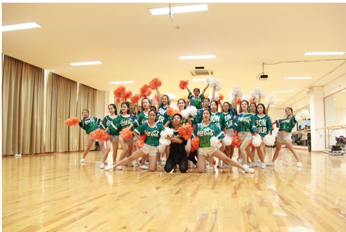
以学院为单位进行健美操比赛中