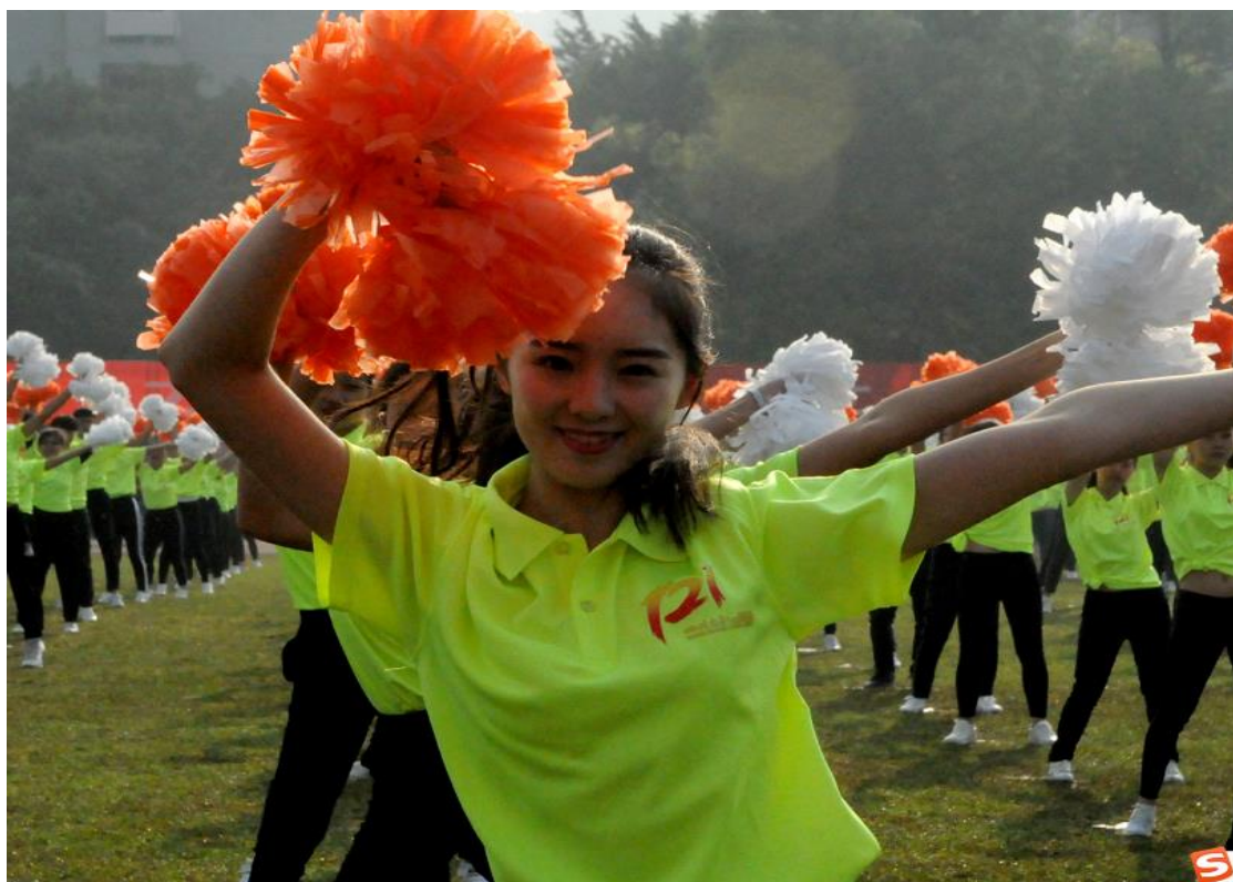
在运动会开幕式的表演中