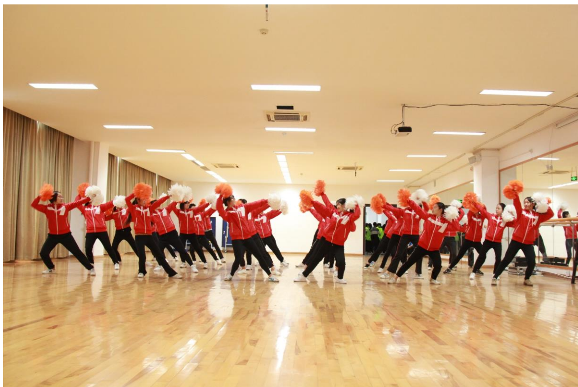
以学院为单位进行健美操比赛中