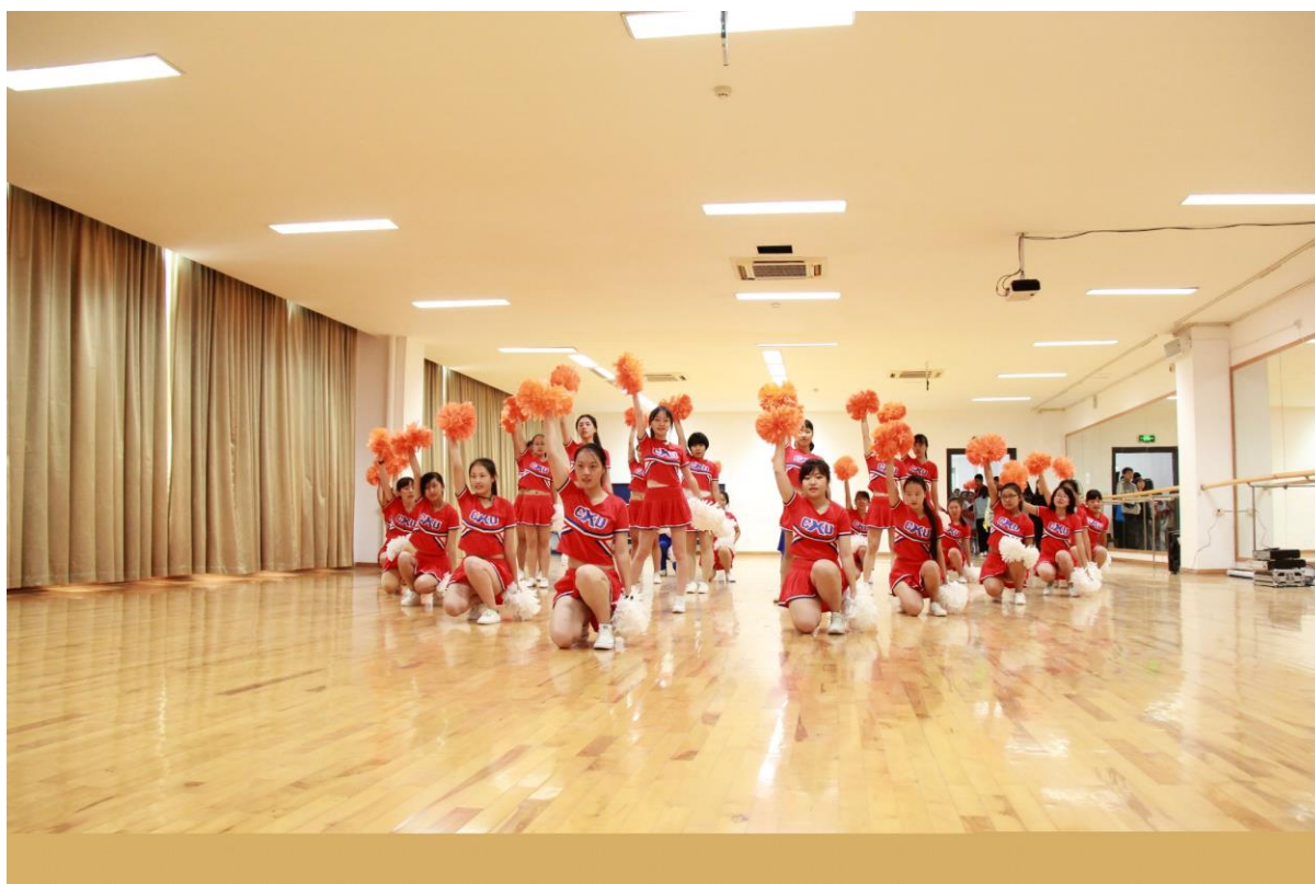
以学院为单位进行健美操比赛中