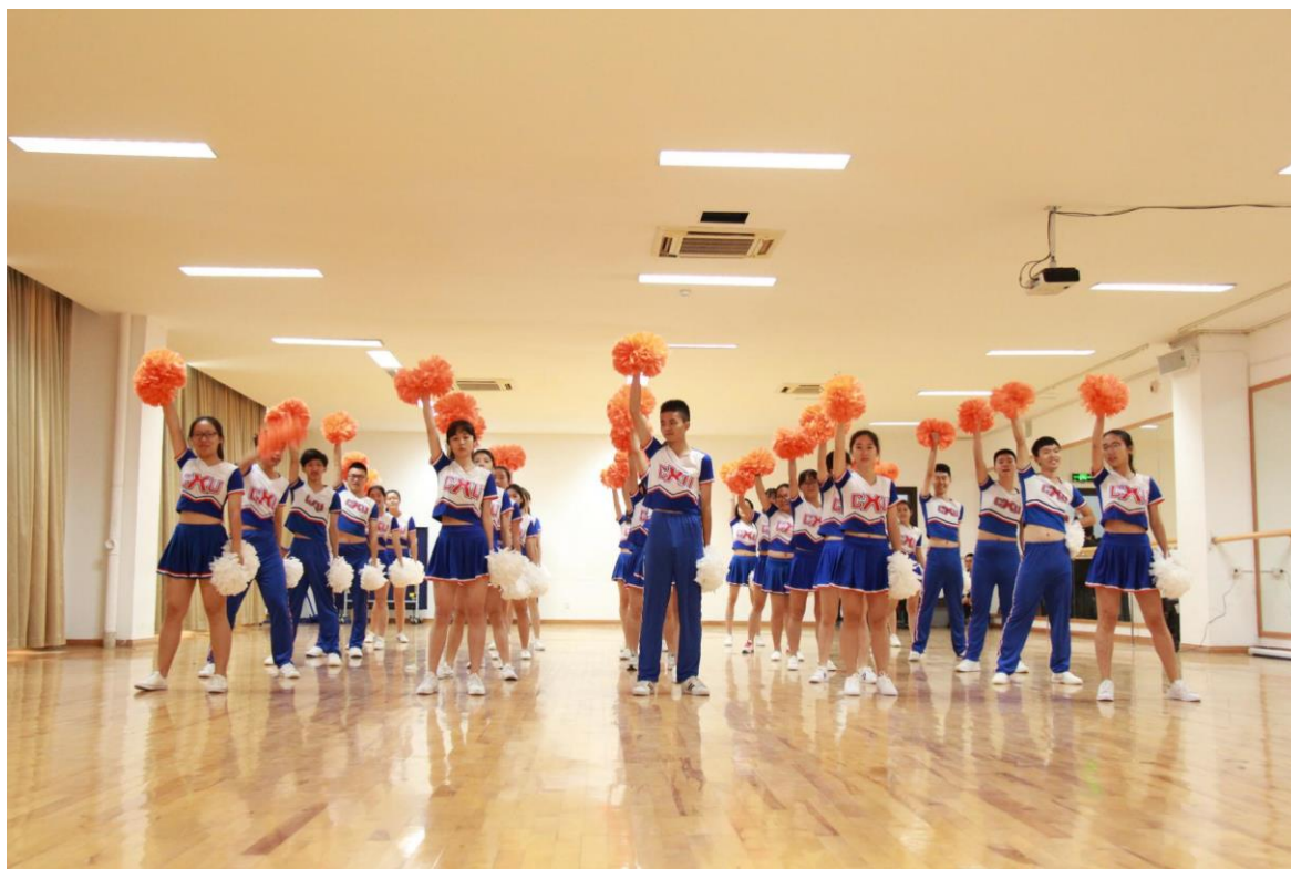
以学院为单位进行健美操比赛中