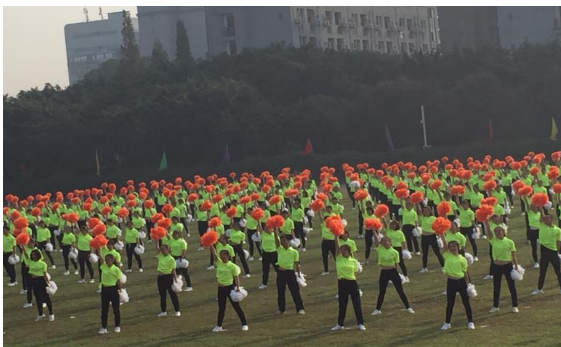
在运动会开幕式的表演中