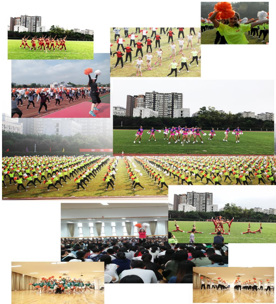
近期教师课内学习、课外辅导最后成果展示